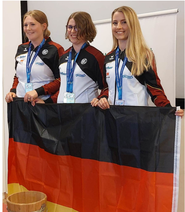
Zweimal Platz 1 beim Weltcup in Innsbruck