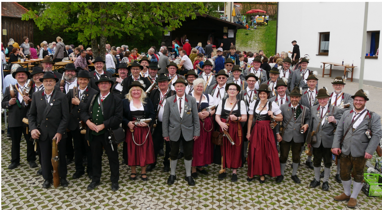
Die Reuter Böllerschützen mit Abordnungen der Steinbergsschützen Gschaid und der Reischacher Böllerschützen nach ihrem lautstarken Auftritt. Im Hintergrund die Gäste.